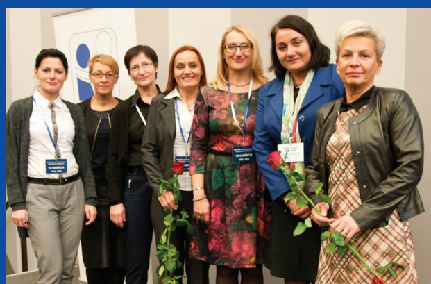
Okręgowy Sąd Pielęgniarek i Położnych