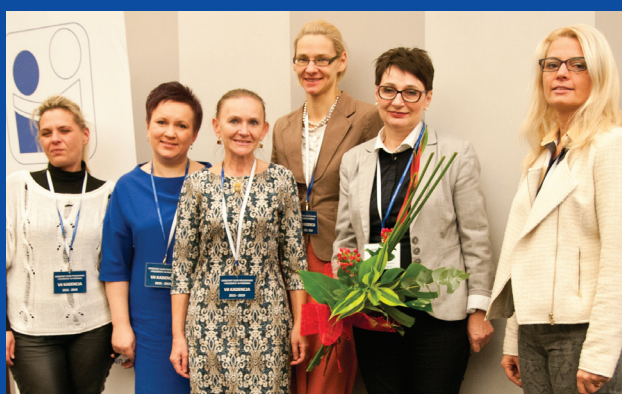
Okręgowy Rzecznik Odpowiedzialności Zawodowej i Zastępcy