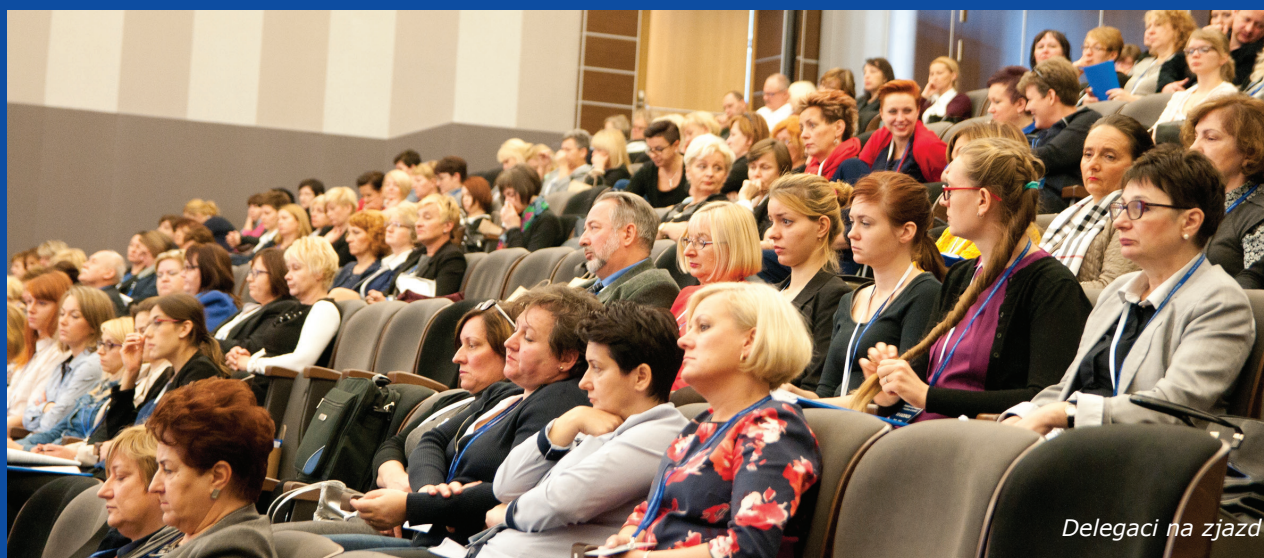
Delegaci na zjazd