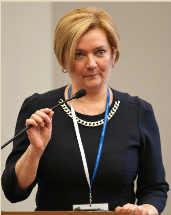
Szanowni Goście Drodzy Delegaci

Kiedy cztery lata temu w październiku 2011 roku rozpoczynaliśmy VI kadencję działalności samorządu, określiłam ją jako czas zmian. Dzisiaj patrząc z perspektywy końca kadencji mogę powiedzieć, że było to bardzo trafne określenie, gdyż zmiany w ochronie zdrowia następowały jedna po drugiej, mając również niemały wpływ na naszą samorządową pracę.